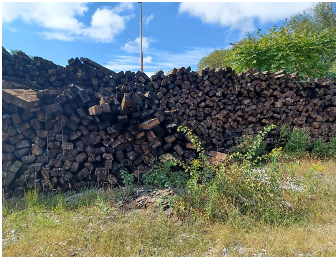
Slika 1: Obravnavani odpadek

Vzorec odpadka je v laboratoriju voden pod laboratorijsko oznako O1-1184/24